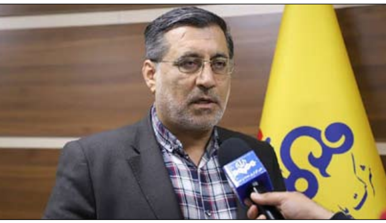
انرژی از سوی تک‌تک افراد جامعه بسیار مهم بوده و مشترکین گرمای با رعایت الگوی مصرف بهینه و رعایت دمای رفاه (۲۱-۱۸ درجه سانتیگراد) شرکت گاز را در ارائه خدمات مستمر یاری نمایند.

صرفه‌جویی مشترکین خانگی و اداری در مصرف گاز تأکید کرد و اظهار داشت: به منظور صرفه‌جویی و مدیریت انرژی، از مسئولان ادارات درخواست شده بود که وسایل گرمایشی سازمان‌ها را یک ساعت قبل از اتمام ساعت کاری و نیز در تعطیلات آخر هفته خاموش کنند. مدیرعامل شرکت گاز استان با اشاره به اینکه این شرکت در انجام رسالت سازمانی و مسئولیت اجتماعی خود با مشارکت نیروهای امداد و مسیجی حوزه گاز، دمای محیط ادارات استان را رصد کرده و از نزدیک مورد پایش قرار می‌دهد، گفت: در طول این دوره بازرسی‌ها، به آن دسته از ادارات و نهادهایی که موضوع صرفه‌جویی یا دمای رفاه را رعایت نکردند در مرحله اول، اخطار کتبی ابلاغ شده است. وی با بیان اینکه این گشت‌ها به